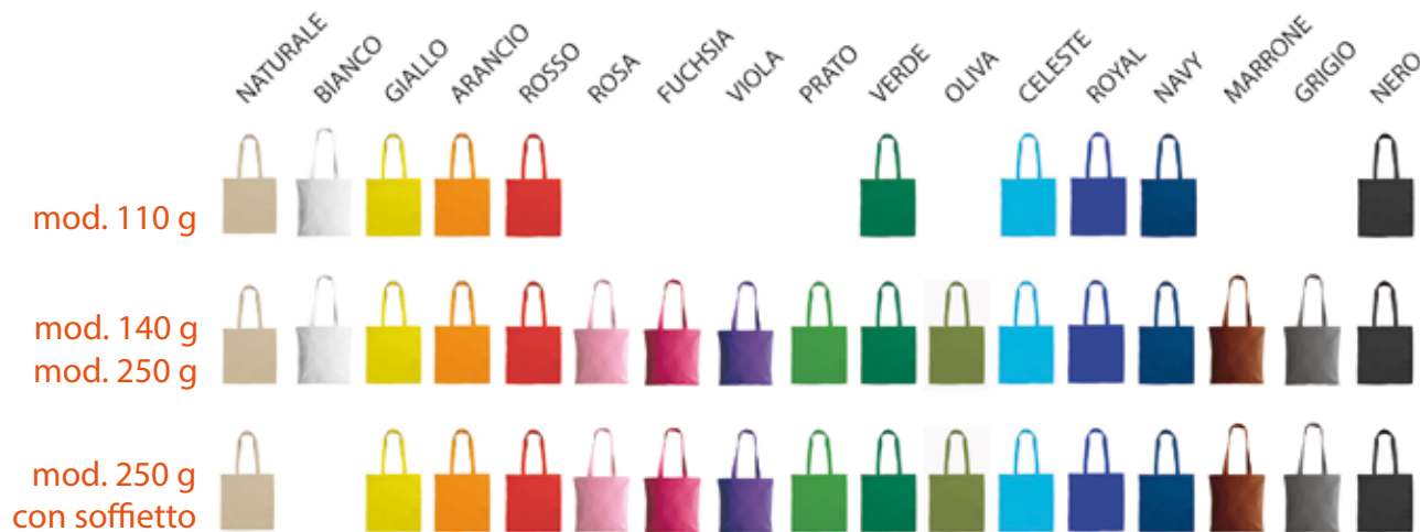
mod. 110 g.

E' disponibile in cotone leggero (110 gr/m 2 ), medio (140 gr/m 2 ) e pesante (250 gr/m 2 ). Quest'ultimo è disponibile anche con soffietto da 8 cm. Lo shopper colorato viene stampato con tecnica serigrafica (superficie massima di stampa 25x35 cm)