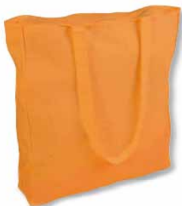
mod. 250 g. con soffietto