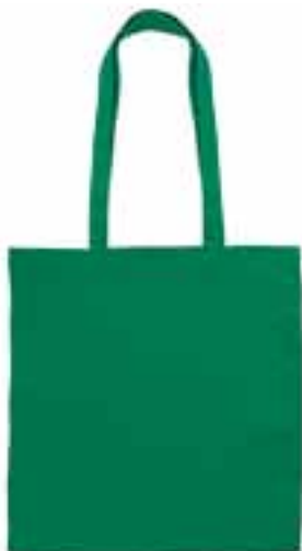
mod. 250 g.